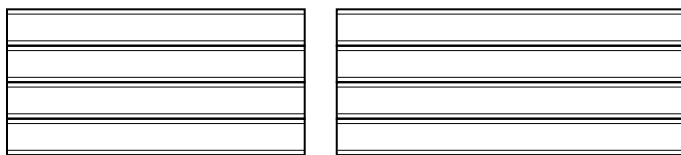
Porte de 14' à 16'